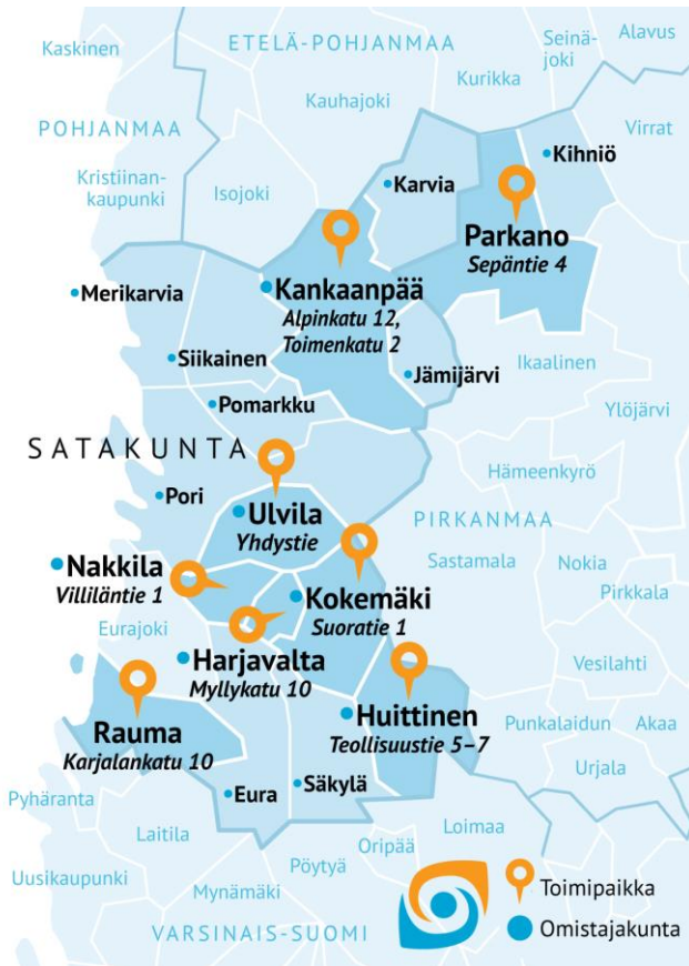
Kuvio 1. Satakunnan koulutuskuntayhtymän jäsenkunnat v. 2024

Alueellisesti kuntayhtymä sijoittui Satakunnan seutukuntiin kuvan osoittamalla tavalla. Kuntayhtymä sijoittuu maakunnallisesti kaikkiin kolmeen Satakunnan seutukuntaan ja Kihniön kunnan osalta Pirkanmaan maakuntaan. Lisäksi kuntayhtymä järjestää koulutusta toimipisteissään Parkanossa ja Raumalla.